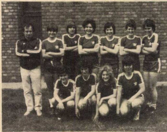
A Budapest 72-es hivatal labdarúgó lányok

— Az első kispályás üzemi bajnokságnak 1972-ben akkora sikere volt, hogy az 1974-75-ös