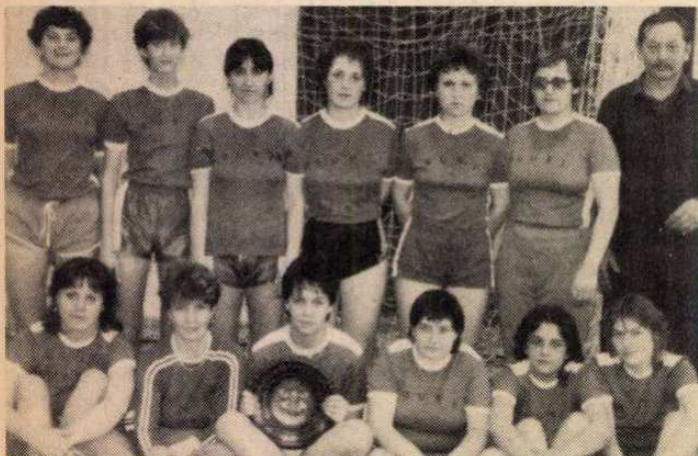
A Balatonfüred kupa győztesei

POSTÁS DOLGOZÓ A Postások Szakszervezetének lapja Szerkesztőség: Budapest XIV., Cházár András u. 13. Postacím: Budapest, Postafiók 14. 1406 Felélő szerkesztő: MEZŐFI LÁSZLÓ Telefon: 428-777 Kiadja a Népszava Lap- és Könyvkiadó Budapest VII., Rákóczi út 54. Telefon: 224-810 Levélcíme: Budapest, Postafiók 32. 1964 Egyszámú száma: MNB 215-51 628 Felélő kiadó: KISS JENŐ igazgató Előfizetési díj egy évre: 24 Ft 85-2183. Szikra Lapnyomda, Budapest Felelős vezető: CSÖNDES ZOLTÁN vezérigazgató ISSN 0230-3701