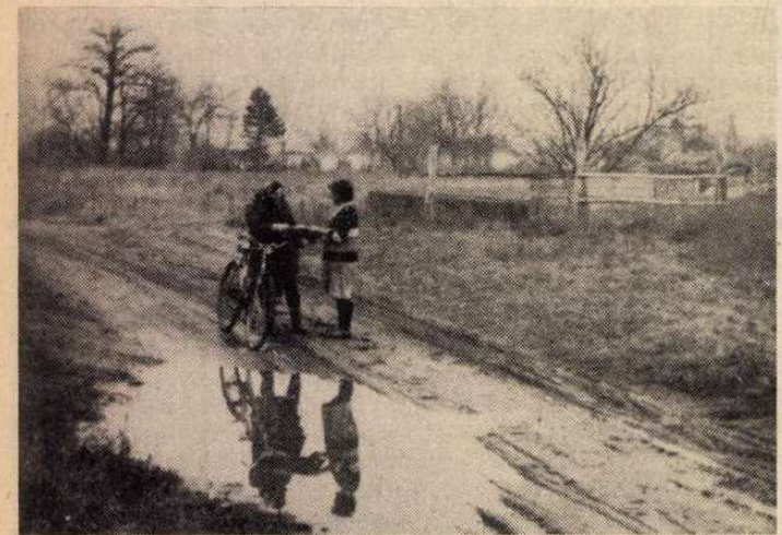
Itt még a petróleum adja a fényt