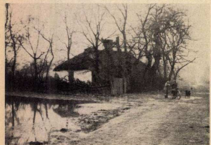
A pocsolja még elkerülhető, a sár nem